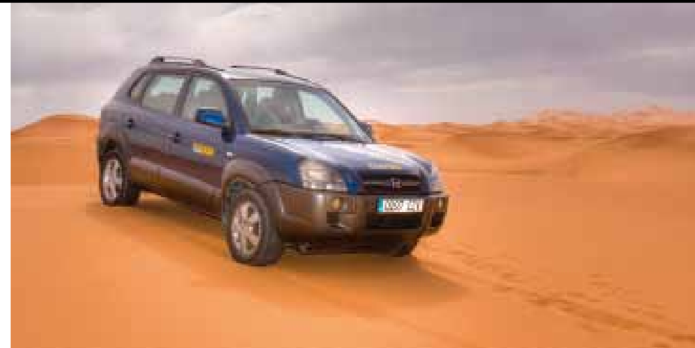
Texto: Mariano García

Nuestro plan era recorrer el país de Norte a Sur en una semana, llegando hasta el Desierto para luego poner rumbo al Oeste hacia el mar y reemprender la vuelta bordeando la costa Atlántica hasta el Estrecho. Pero este viaje reservaba un componente tanto o más importante que el propio disfrute de los dos ocupantes: la solidaridad. Por ello, sin dudarlo un momento, decidimos tumbar los asientos posteriores y cargar el Hyundai Tucson hasta los topes con todo aquello que pudiera ser de utilidad a nuestros vecinos del Sur: ropa, calzado, material escolar, caramelos, etc. Tras enlazar Barcelona y Algeciras, embarcamos con el ferry de Balearia hasta Ceuta.